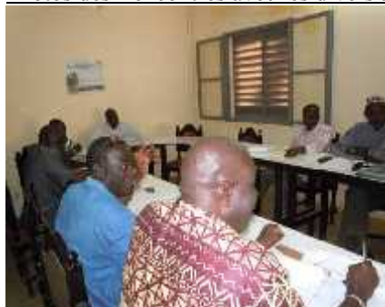
Rencontre avec le CRRA de Sikasso