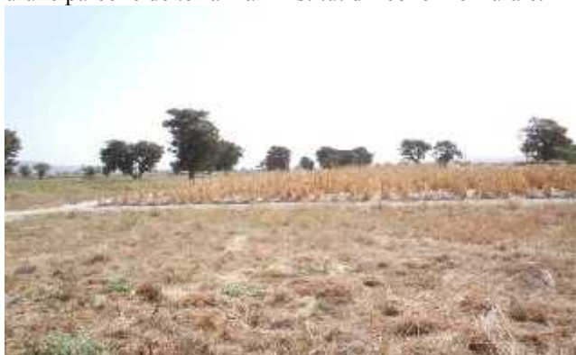
Site d'expérimentation du sorgho fourrager dans la station de Sotuba 268 ha

Le site dispose d'un titre foncier depuis 1998 suivant le Décret n° 98-227 P-RM du 06 juillet 1998 portant affectation d'une parcelle de terrain à l'Institut d'Economie Rurale.