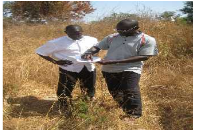
Entretien avec le Chef p.i. du CRZ de Kolda