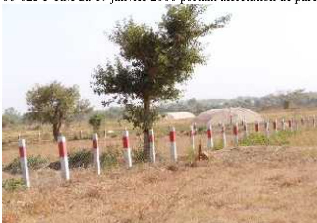
Site d'expérimentation du riz de bas fond dans la station de Sikasso à Longolora 10 ha 71a 73 ca

Les sites des stations de Longolora s'étendent respectivement pour celui du bas fond de 10 ha 71 a et 73 ca et celui de la zone exondée de 11 ha 79 a 89 ca. Le premier est entièrement clôturé par un grillage avec des piquets en ciment béton de balise rouge et blanc. Et le second est ceinturé en partie par un rideau naturel et de l'autre par un grillage très dégradé voire même inexistant par endroit. Tous les deux sites disposent de titre foncier qui date de 2000 suivant le Décret n° 00-023 P-RM du 19 janvier 2000 portant affectation de parcelles de terrain à l'Institut d'Economie Rurale.