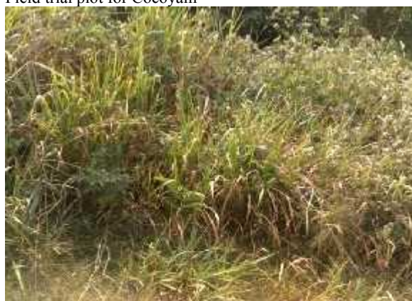
Empty land available for field trial