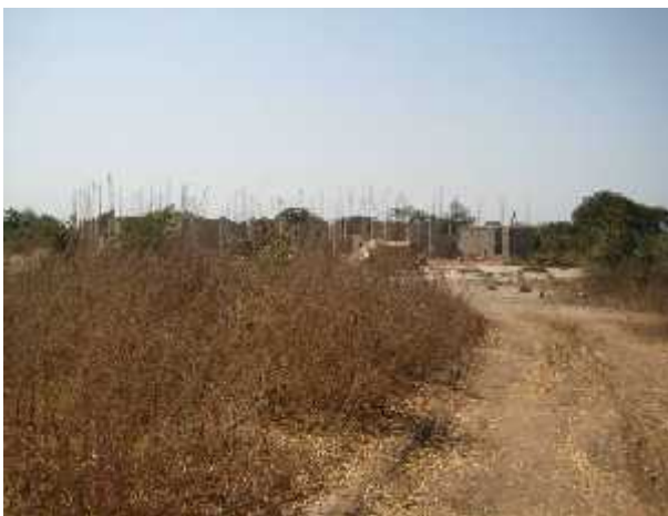
Institut islamique en construction sur le site du CRZ Kolda