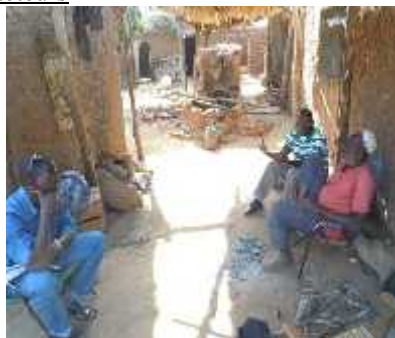
Rencontre avec le chef de village Longorola