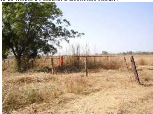
Site d'expérimentation du riz en zone exondée dans la station de Sikasso à Longolora 11 ha 79 a 89ca