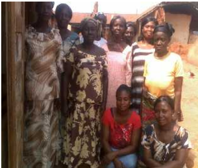
Members of Nokware Women's Farmers Association, Nokware Village, Ghana

Some the points raised are actually going to be areas of focus in WAAPP Phase II