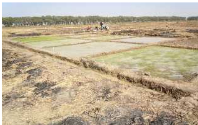
Site d'expérimentation du riz dans la station de Niono 196 ha 94 ares 52 centiares.