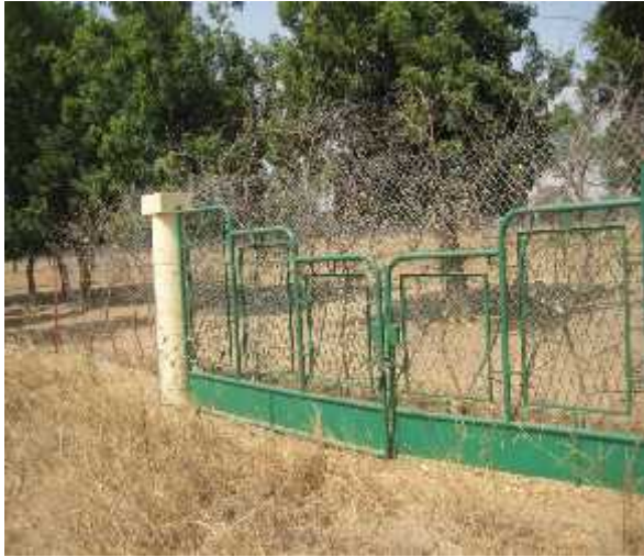
Clôture et portail de la station du CNRA de Bambey