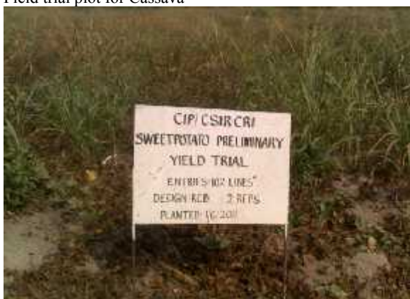
Field trial plot for Sweet Potato