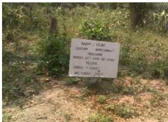
Field trial plot for Cocoyam