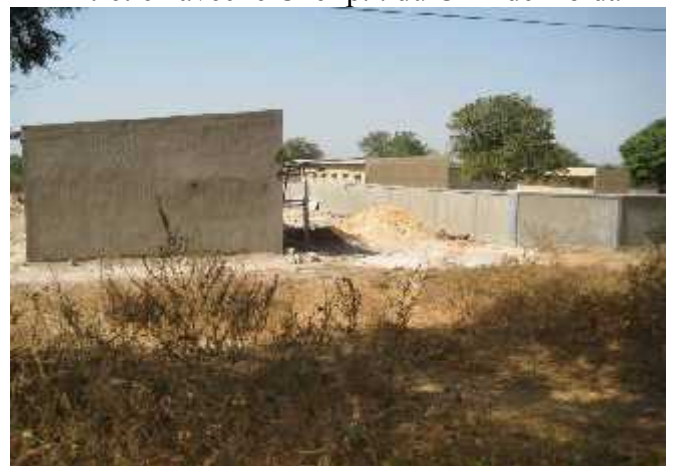
Construction d'un Lycée dans les terres du CRZ Kolda