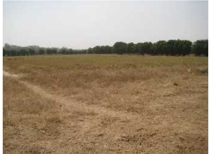
Parcelle expérimentale du CNRA de Bambey