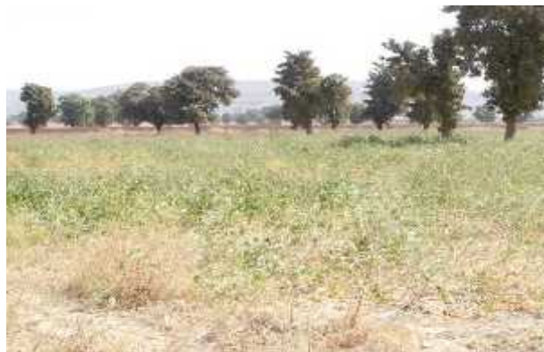
Site d'expérimentation de cultures fourragères dans la station de Sotuba 268 ha.