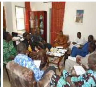
Rencontre avec le CRRA de Sotuba