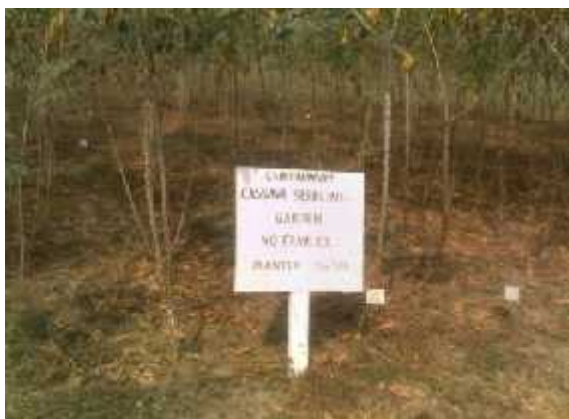
Field trial plot for Cassava