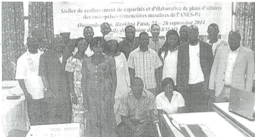
Cet atelier est le premier d'une série qui vise à doter le maximum d'entreprises semencières de plans d'affaires

Le spécialiste en communication du PPAAO-Burkina